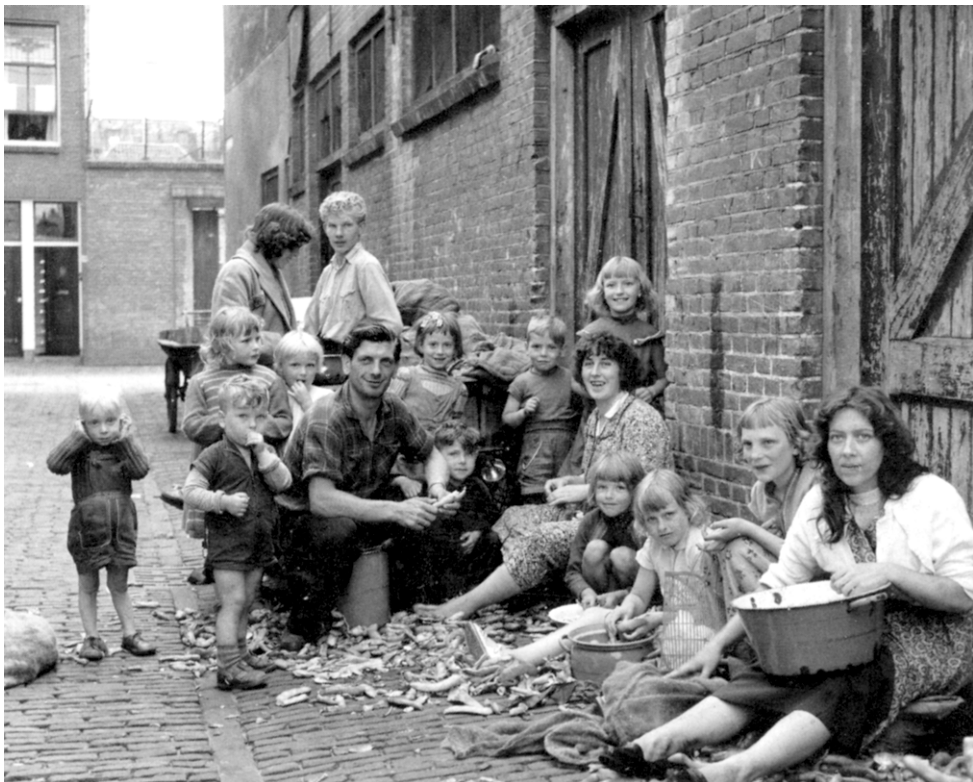
Foto uit 1957 van een gezin dat bonen dopt voor een conservenfabriek in Leiden