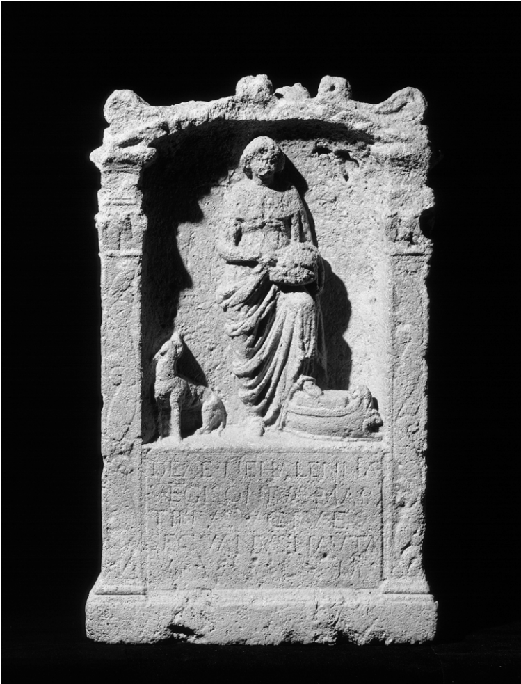
Foto van een votiefsteen (een offersteen die uit dankbaarheid aan een god of godin is beloofd), uit de periode 170-270, gevonden bij Colijnsplaat in Zeeland