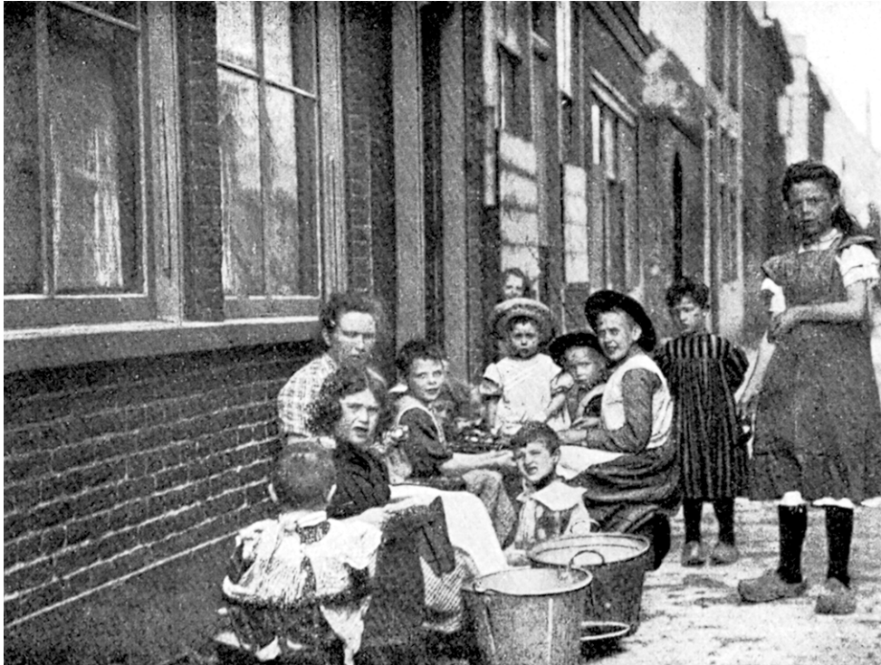
Foto uit 1911 van een uienschilster met helpende kinderen bij haar huis